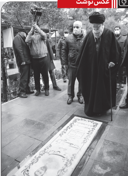
حضور رهبر انقلاب بر سر مزار شهید آرمان علی وردی در گلزار شهدای بهشت زهرا، ۱۴۰۱/۱۱/۱۱